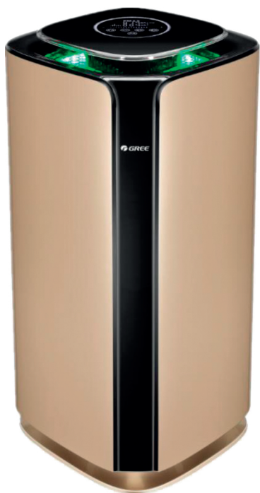
Пресен въздух PM = 2.5 < 35

3 цвята за 3 различни стойности на качеството на въздуха