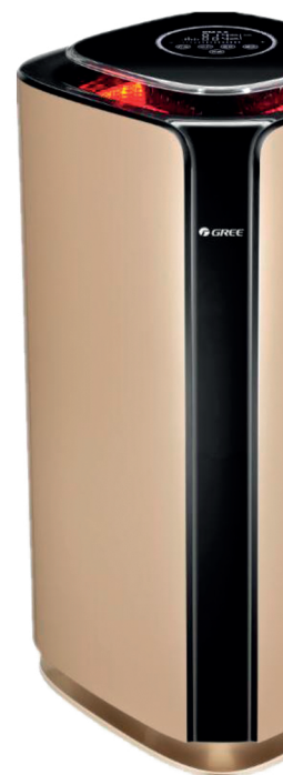
Замърсен въздух PM = 2.5 > 115