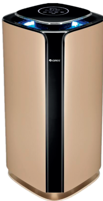
Нормален въздух PM = 2.5: 36~115