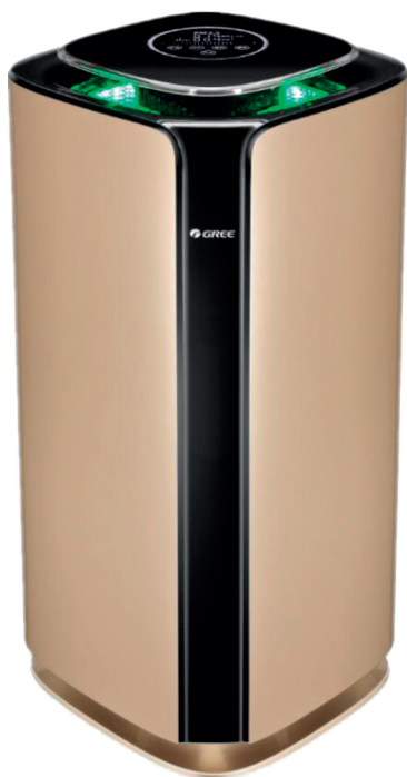
Пресен въздух PM = 2.5 < 35

3 цвята за 3 различни стойности на качеството на въздуха